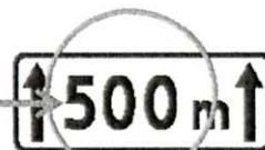
Rys. 3.1.3.2. Tabliczka T-20

Jeżeli zakaz wyrażony znakami B-33, B-35, B-36, B-37, B-38, B-41 obowiązuje pomiędzy skrzyżowaniami na odcinku o długości do 500 m, to dopuszcza się umieszczenie pod znakiem tabliczki T-20 (rys. 3.1.3.2) wskazującej długość odcinka drogi, na którym zakaz obowiązuje.